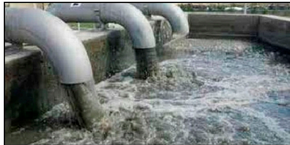
LODOS DE DEPURADORA